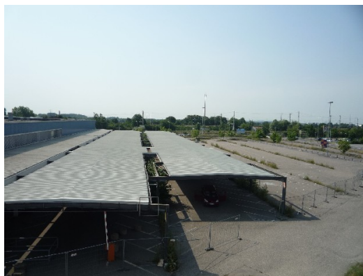
Parkplätze, z.T. überdacht