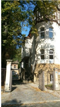
Eingang zum Grundstück

Preiswertes großes u. attraktives Büro/Studio/Showroom im Dachgeschoß einer in historisc